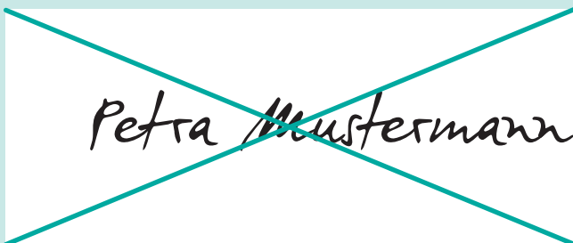
Falsch: Unterschrift rechtsbündig