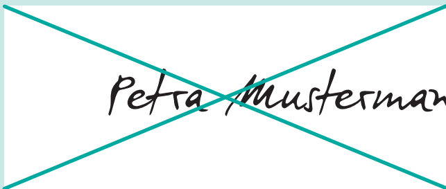
Falsch: Unterschrift nicht innerhalb des Feldes